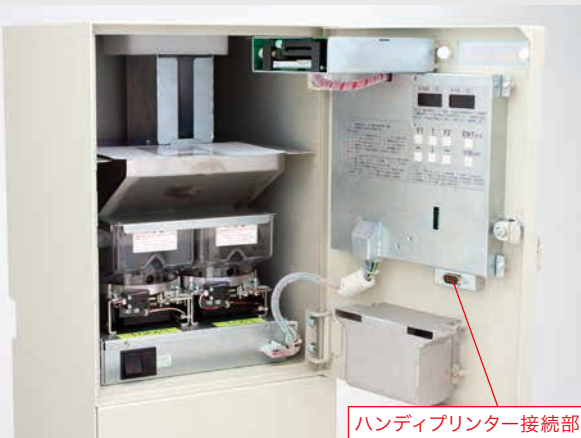
ハンディプリンター接続部